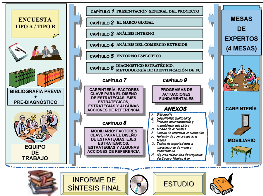
Figura A.1 Estructura del proyecto

El informe final del Plan Estratégico de las Actividades de Carpintería y Mobiliario de Galicia se estructura en un total de 9 Capítulos y 8 Anexos que se exponen en la Figura A.1.