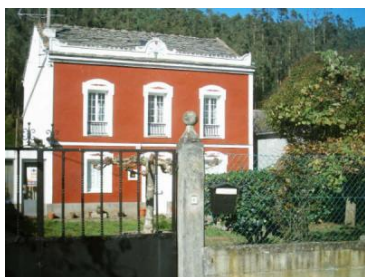
CASA INDIANA NO VALADOURO